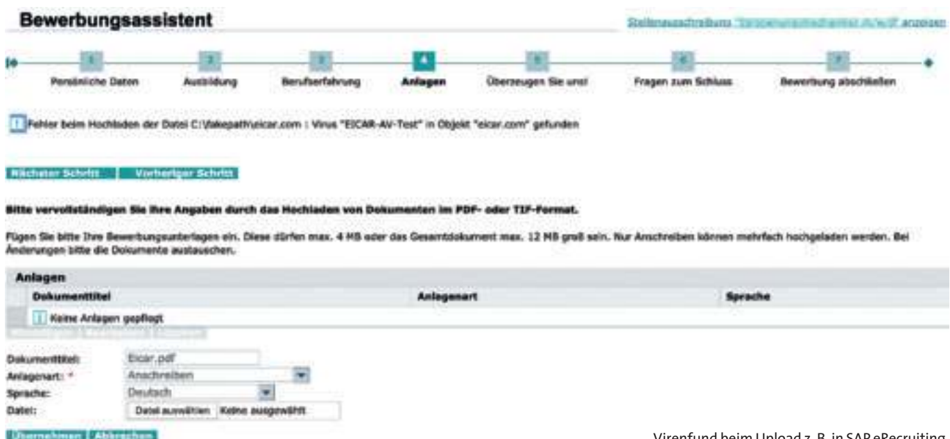
Virenfund beim Upload z. B. in SAP eRecruiting.